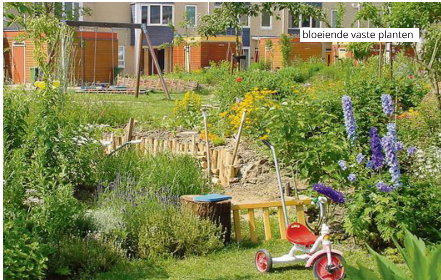
bloeiende vaste planten