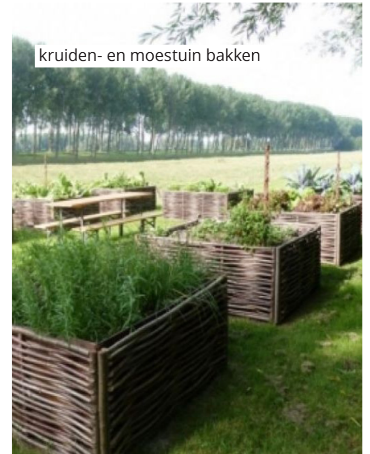
kruiden- en moestuin bakken